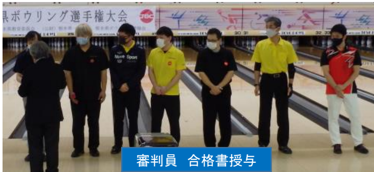
審判員 合格書授与