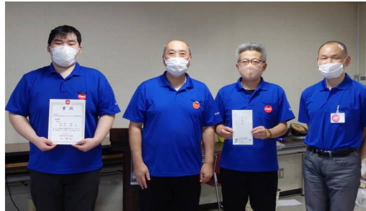
順優勝 実業団チーム