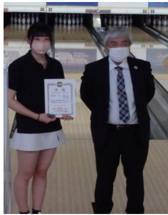
関東地区選手権入賞者 表彰