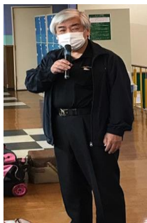
大会会長挨拶 福地理事長