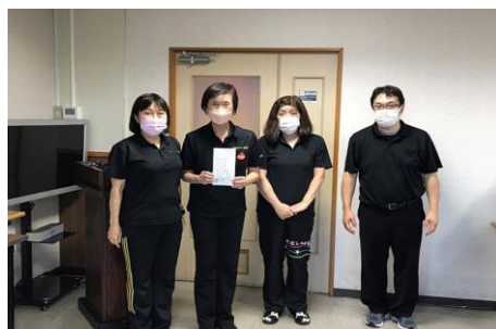
ペーカー方式 H/G 県央Cチーム