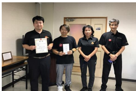
準優勝 県北チーム