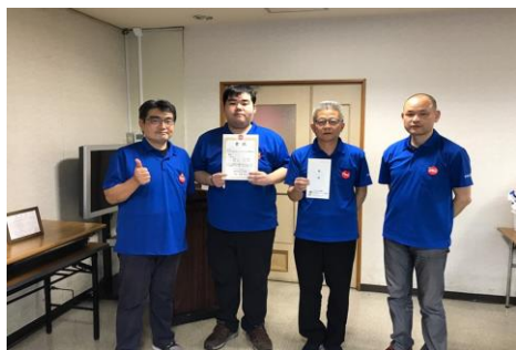
優勝 実業団チーム