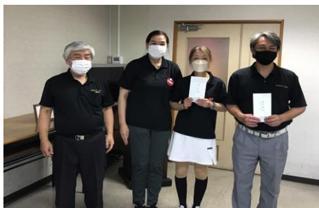
レギュラー方式 チームH/S & H/G 県南Bチーム